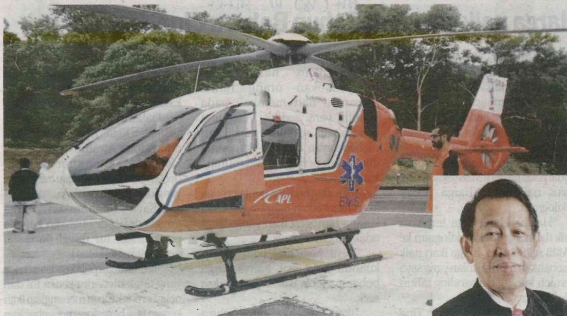
Helikopter jenis Airbus H135 9M-DRA diubahsuai kepada ambulans udara. Gambar kecil: Norhizan

Norhizan berkata, ambulans udara ini dijangka memulakan operasi pemindahan pesakit pada 16 Januari setelah latihan selesai.